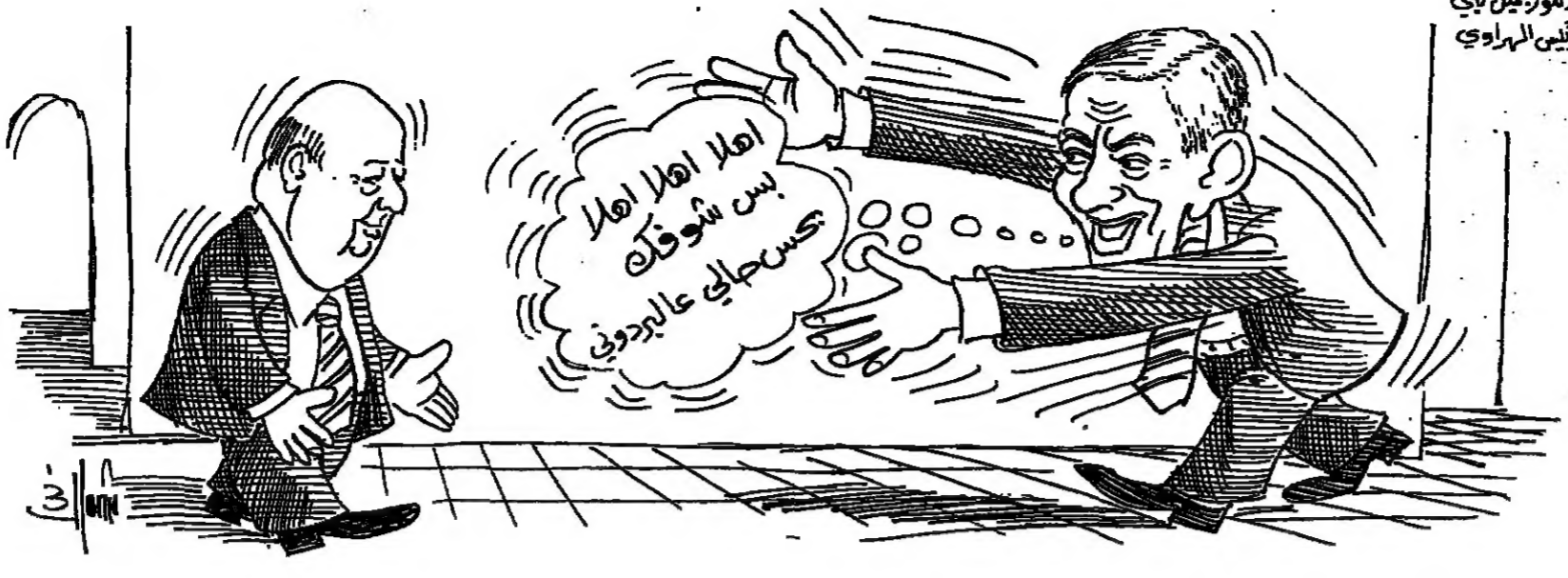
زار امس الكونغرس في واشنطن الرئيس اليماني

مصرات ● اسلام اباد - قال امس راديو كابل ان ١٩ شخصاً قتلوا وجرح ١١ عندما اطلق المجهزون الافغان الذين يقاوتون الحكومة المدعومة من الاتحاد السوفياتي صواريخ على العاصمة الافغانية كابل. ● القاهرة - اذت صف مصرية ان مصر تسلمت ١٤٨ دبابة اميركية سحبتها الولايات المتحدة من اوروبا الغربية. ● نيروبي - اعلنت الجبهة الشعبية لتحرير ايرتريا ان غارات جوية للقوات الجوية الاثيوبية اذت امس الاول ان مصرع ٥٥ شخصاً في ميناء مصوع الذي يسيطر عليه الثوار. ● انقرة - ذكرت وكالة انباء الاتصالي ان شحنة قذات ستة اطفال واصابت ثلاثة اخرين بجروح خطيرة امس، حين همت حشداً في محطة الحافلات في كيرابرا في اقليم قونية بوسط الاتصالي. ● نيودلهي - قالت الشرطة ان سبعة اطفال ورجلا لقوا مصرعهم امس عندما شب حريق في اكوام بلحدي المناطق الفقيرة في العاصمة نيودلهي. ( ر - ا ف ب )